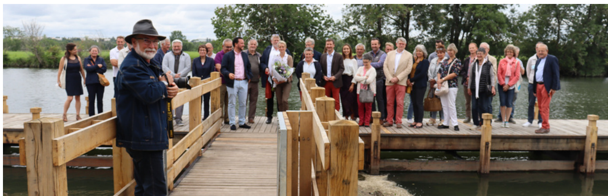
Photographie prise lors de notre première journée de rencontres annuelle aux Gonds en juillet 2021

L'association apolitique « Les Maires pour la Planète » a été créée fin 2019 dans le but d'aider les maires à agir au quotidien pour préserver l'environnement. Alors que les désordres climatiques vont bouleverser nos vies et celles de nos enfants, comment en effet imaginer rester les bras croisés ? L'association souhaite dynamiser la transition écologique en créant un réseau fort de communes s'inspirant des bonnes pratiques environnementales de chacune d'entre elles. En 2022, l'association compte 112 communes réparties sur le département de la Charente-Maritime.